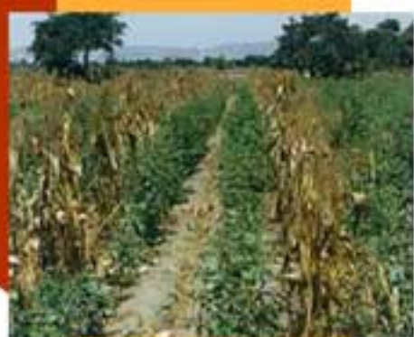
Gramínea con leguminosa