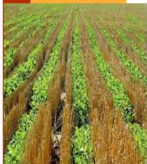
Asociación de cultivos