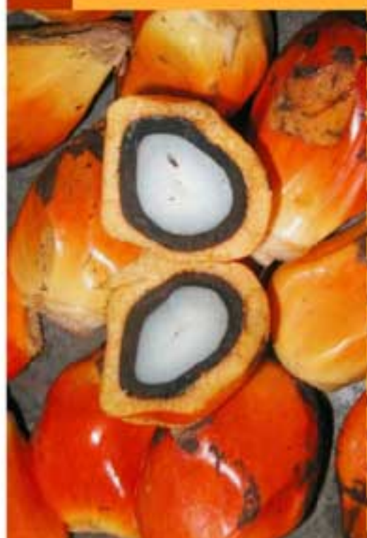
Fruto de Palma Africana

El norte quiere saciar su necesidad de lujos, consumo y energía a cambio del hambre del sur.