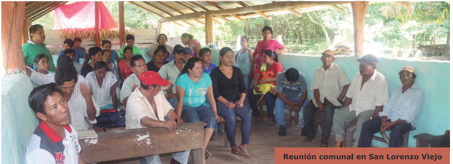
Reunión comunal en San Lorenzo Viejo

En esas condiciones avanza la expansión del extractivismo en el país y su carrera por la extracción irracional de los recursos naturales, con un alto costo social y ambiental, cuyas consecuencias se presentan más allá de las áreas donde se desarrollan los proyectos. Frente a ello debemos sumar fuerzas para defender el derecho a un medio ambiente sano, que sea sustento de vida de las presentes y futuras generaciones. El ejercicio del mismo pasa por tener la posibilidad de definir qué tipo de desarrollo deseamos en nuestros territorios.