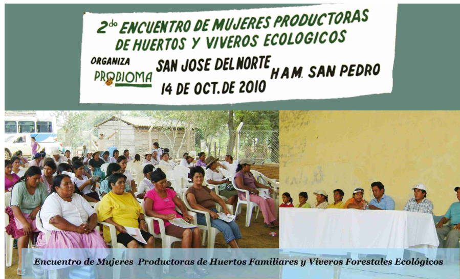
Encuentro de Mujeres Productoras de Huertos Familiares y Viveros Forestales Ecológicos

El 4 de septiembre de 2009 se realizó el Primer Encuentro de Mujeres Productoras de Huertos Familiares y Viveros Forestales Ecológicos, en la localidad del Núcleo 14 perteneciente al Municipio de San Julián, donde participaron los municipios de San Pedro con las comunidades de San José del Norte y Sagrado Corazón, el Municipio de 4 Cañadas con San Miguel de los Ángeles y la comunidad anfitriona. En este primer encuentro todas las agrupaciones de mujeres presentes participaron del intercambio de experiencia realizadas en las parcelas de producción de hortalizas y viveros forestales orgánicos presentadas por las anfitrionas.