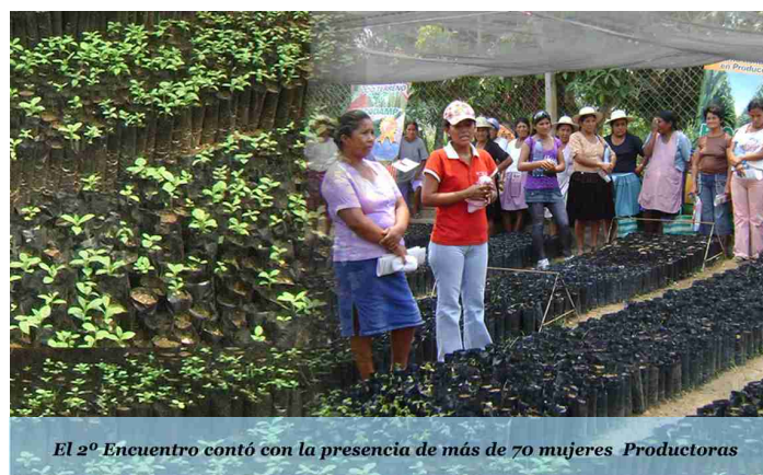
El 2º Encuentro contó con la presencia de más de 70 mujeres Productoras

Las anfitrionas también explicaron el trabajo que se hace dentro del vivero forestal manejado por ellas y del control de plagas con productos biológicos y orgánicos.