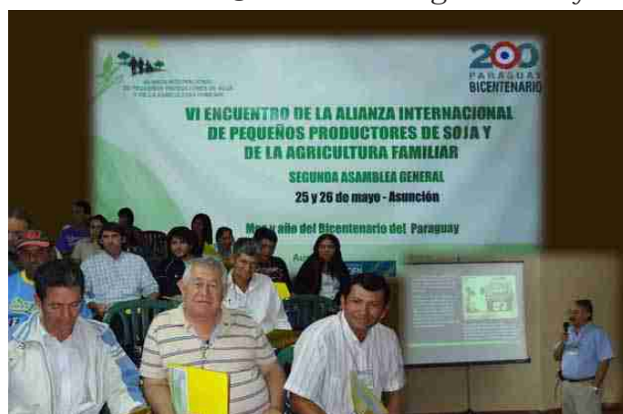
VI Encuentro de la Alianza Internacional de Pequeños Productores de Soya y de la Agricultura Familiar -Asunción PARAGUAY

Lo anterior refleja que la Alianza se ha fortalecido con el aporte activo de sus socios, aportando de manera concreta a la seguridad y soberanía alimentaria con propuestas alternativas a los agronegocios, aplicando tecnologías limpias e incursionando en la producción de semillas No transgénicas y libres.