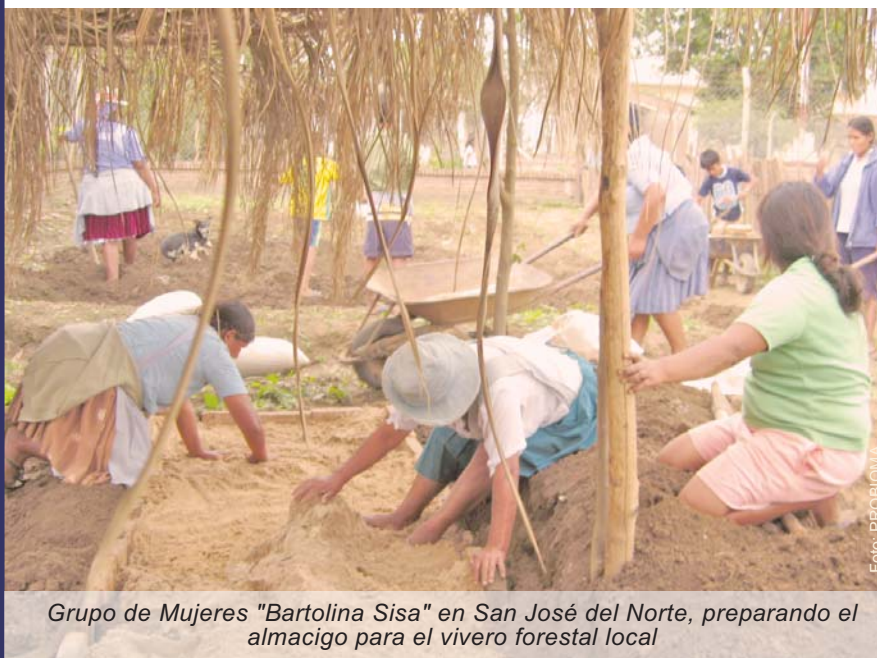
Grupo de Mujeres "Bartolina Sisa" en San José del Norte, preparando el almacigo para el vivero forestal local

Es en este sentido, que el Programa de Manejo Responsable de Soya, implementado por PROBIOMA, ha visto necesario desarrollar una línea de apoyo específico para grupos de mujeres de las zonas soyeras. Este apoyo está dirigido a un manejo ecológico y orgánico de hortalizas y frutales, sin el uso de agro-