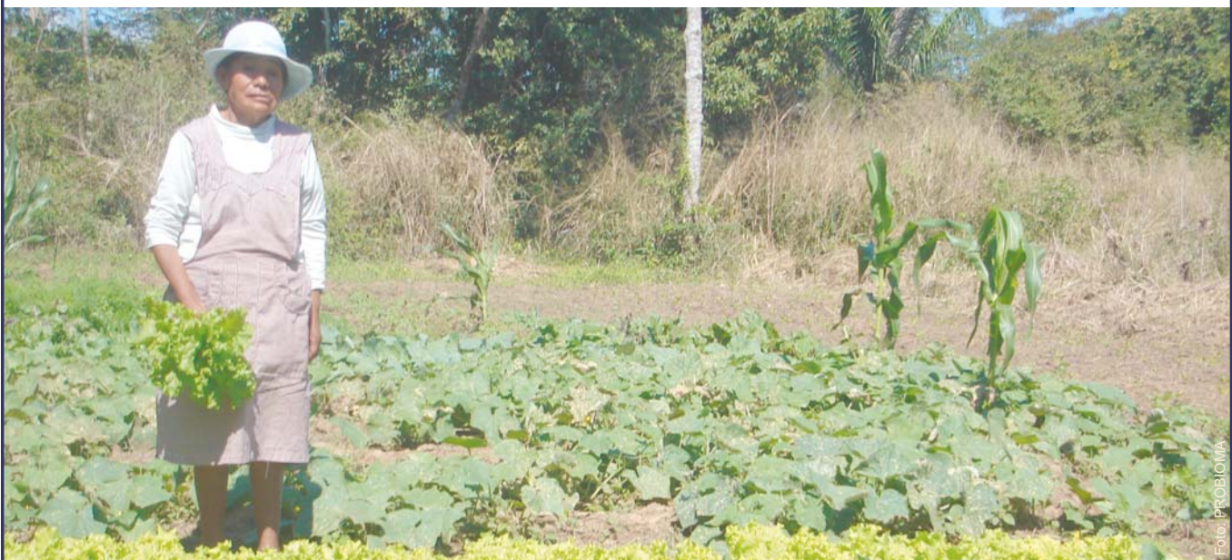
Sra. Nicolasa Flores, del grupo de mujeres de Núcleo 14, en su huerto ecológico. Nicolasa cuenta con una área de producción de 1 tarea, y está produciendo lechuga, repollo, zapallo, pepino, maíz, frejól, vainita y otros.

Felicitemos a todas las compañeras que han asumido el compromiso de la producción ecológica en sus huertos familiares, y el manejo ecológico de viveros forestales. Esperamos poder incorporar muchas más mujeres a estas iniciativas durante las próximas campañas.