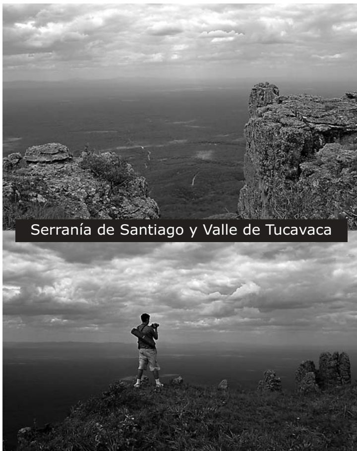
Serranía de Santiago y Valle de Tucavaca