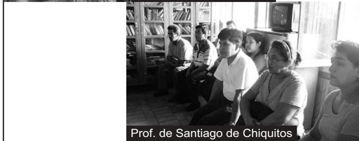
Prof. de Santiago de Chiquitos