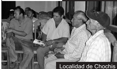
Localidad de Chochis