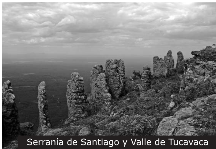
Serranía de Santiago y Valle de Tucavaca

El que las Áreas Protegidas sean consideradas como patrimonio, siendo de interés público y social, se debe esencialmente a que éstas son la principal fuente de vida que tenemos en nuestro país. Bolivia es reconocida como el octavo país con mayor biodiversidad en el mundo y es en las Áreas Protegidas donde, principalmente, se encuentra la mayor cantidad de especies, que en muchos casos son únicas en estas áreas. Además, en su mayoría, son reservorios o abastecedoras de agua dulce, es claro que sin agua no hay vida.