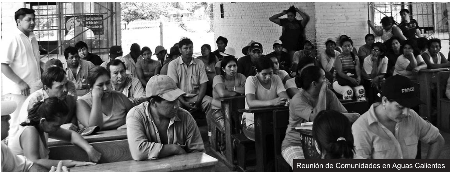
Reunión de Comunidades en Aguas Calientes

Las comunidades, que ahora se encuentran informadas y con una posición clara, de defensa del Ecosistema Pantanal y Tucavaca, exigen el respaldo del Municipio y la Prefectura, con planes de desarrollo sostenible que saquen de la pobreza y abandono a estas comunidades.