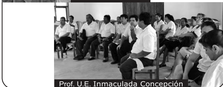
Prof. U.E. Inmaculada Concepción

Como parte del apoyo al fortalecimiento organizativo a las comunidades, para que asuman un papel de liderazgo en las problemáticas regionales, con los profesores de la UE Inmaculada Concepción de Chochis, el 17 de noviembre, se realizó un taller, donde se hizo un repaso a la historia de la región, en el marco de la historia boliviana, desde las culturas prehispánicas hasta nuestro tiempo. Se realizó un rico análisis sobre la importancia de la zona y el manejo que se ha dado a los recursos naturales a lo largo de la historia del país.