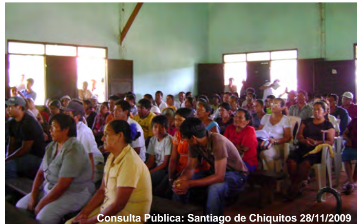
Consulta Pública: Santiago de Chiquitos 28/11/2009

En un acto desesperado, un día antes de la realización de la Consulta Pública consultores de Kyleno se hicieron presentes en la comunidad que sería directamente afectada, San Lorenzo Viejo, (con cafecito, carne, entre otros) para realizar una reunión de última hora en la que se habló de empleo, desarrollo e incluso de la reconstrucción