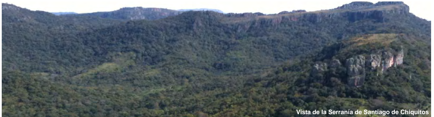
Vista de la Serranía de Santiago de Chiquitos

El 2012, conociendo las intenciones de la empresa minera Montecarlo S.A de realizar trabajos en las Serranías de Santiago, las comunidades han activado sus mecanismos de organización, en defensa de su reserva. Convencidos de que la Reserva de Vida Silvestre Valle de Tucabaca es la fuente de agua (vida) para el Municipio, han ratificado su decisión de decir: ¡No a la minería en nuestra Área Protegida!